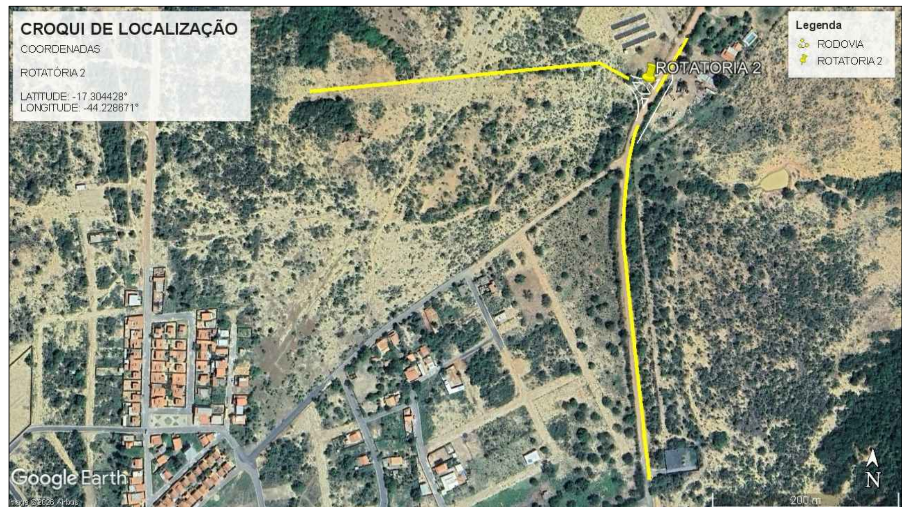
19 CROQUI DE LOCALIZAÇÃO